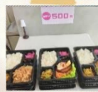
お弁当・惣菜・とん汁