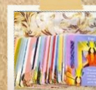
カード・名前占い