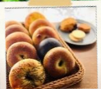
ベーグル・焼き菓子