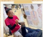
カイロプラクティクス体験