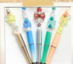
カスタムボールペン