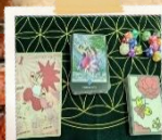
禅タロット&誕生数秘術