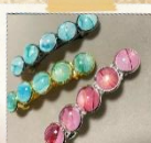
インクアートのアクセサリ