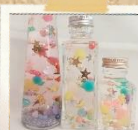
ぶかぶかハーバリウム