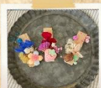
デコレーションクリップ