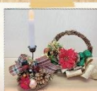
季節のワークショップ