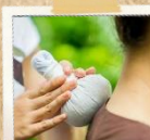
ハープボールの体験