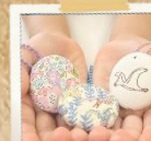
くるみボタンのキーホルダー