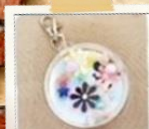
カプセルキーホルダー