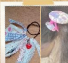
布リボン くるみぼたん ヘアゴム