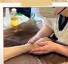
ハンドトリートメント