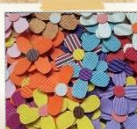
紙バンドのお花カード