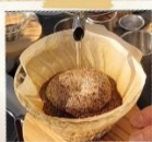
ドリップコーヒー・豆